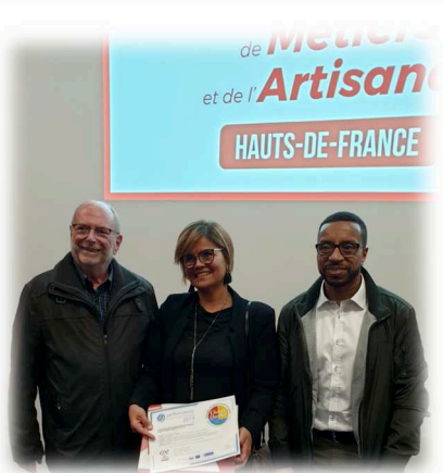
La remise du diplôme en présence du maire